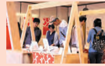
総合案内所 うるしの里会館 (福井県鯖江市西袋町40-1-2)