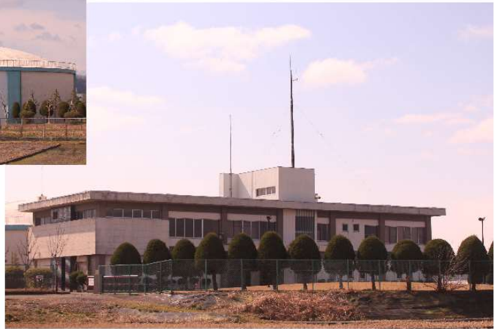
鯖江市上水道管理センター