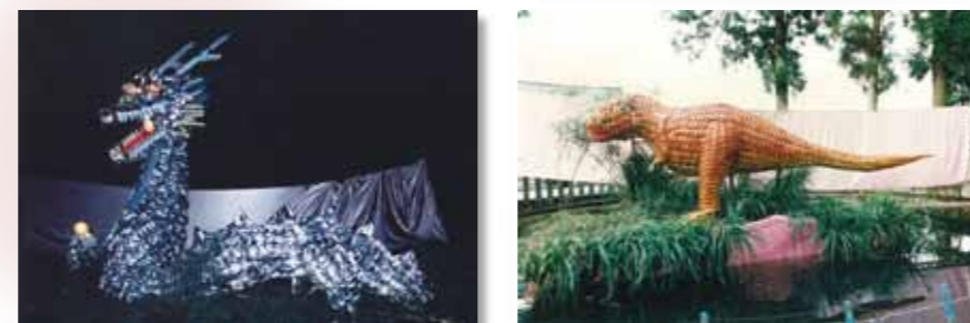
日吉神社の夏祭り(野田のお寄り)時 池の中に作られ続けてきた“飾りもの”

発行 豊地区青少年育成協議会 事務局 豊公民館 助成 豊まちづくり推進協議会 協力 豊地区区長会 豊婦人福祉協議会 印刷 株式会社 斎藤印刷