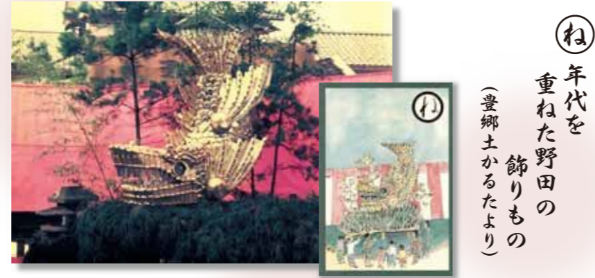
ね 年代を 重ねた野田の 飾りもの (豊郷土かるたより)