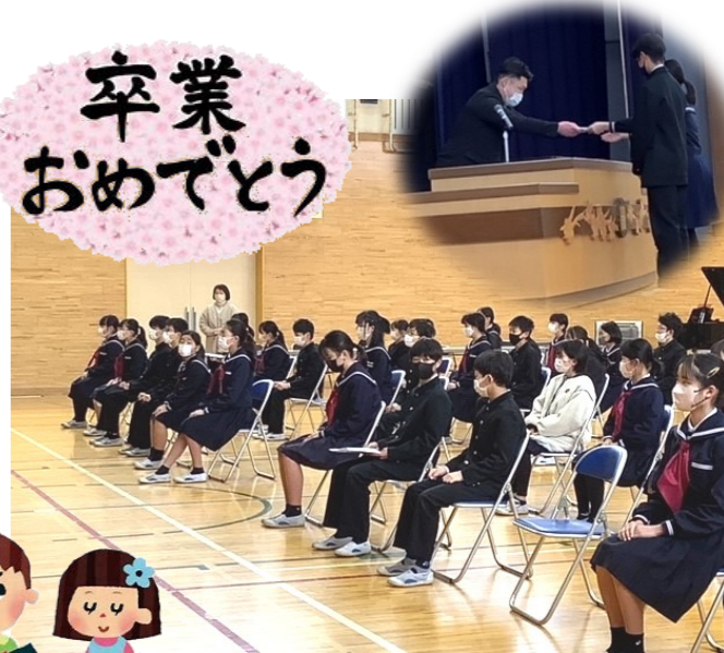
主催：豊地区青少年育成協議会

3月12(火)に卒業された豊小学校6年生の皆さんの新しい門出をお祝いし、皆さんの健康と活躍を心より祈っています。