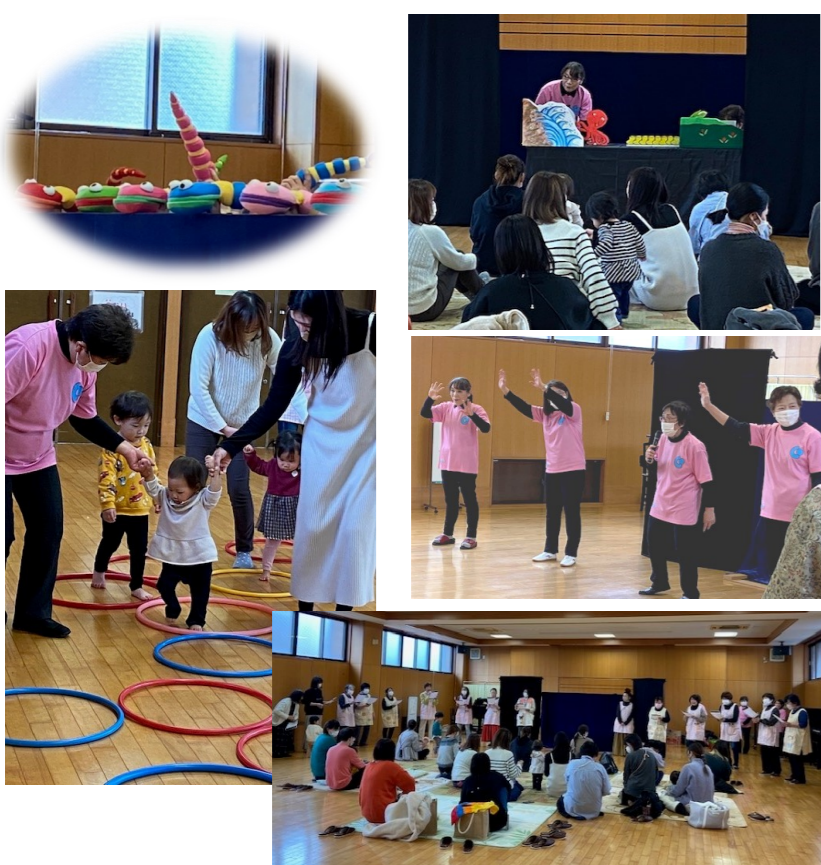
主催：子育て支援ネットワーク委員会

まだ保育園に入園しない親子の皆さんは、これからも子育て広場や子育て事業に、参加してくださいね。