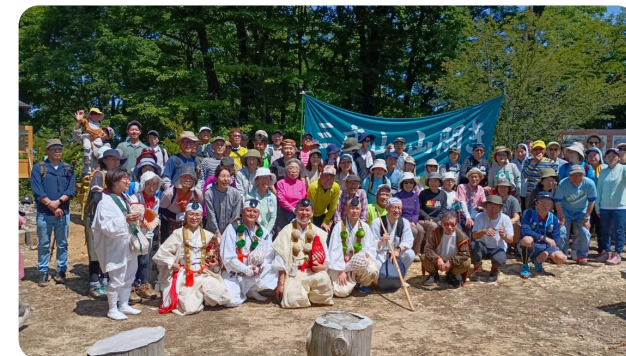
【三床山を愛する会】