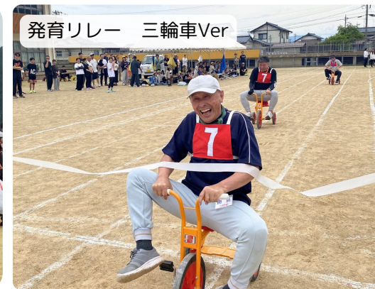
発育リレー 三輪車Ver