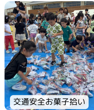
交通安全お菓子拾い