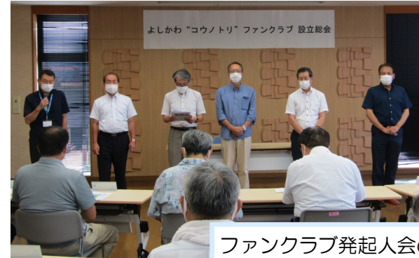
ファンクラブ発起人会の皆さん

吉川地区で国の特別天然記念物コウノトリの雄のひな(あおたくん)が市内初の巣立ちを迎えたことを受け、よしかわ“コウノトリ”ファンクラブ設立総会を開き、コウノトリが飛来する豊かな生態系と自然環境を維持していくことを目標に掲げました。