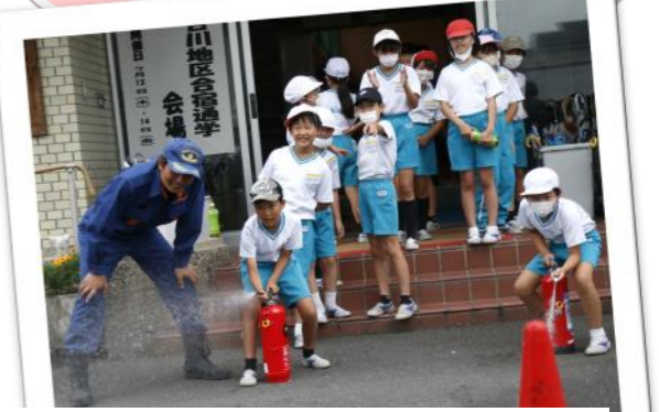
火元をよーくねらって、消火体験

・地震の怖さ、火災に関してのけむりの怖さ、消火器の使い方を学びました。東日本大震災はすごい揺れがあってとてもおどろきました。けむり体験ではまわりが少ししか見えませんでした。防災クイズでは、ひなんする場所がわかりました。合宿通学のおかげで、災害に関することがいろいろ学べて楽しかったです。