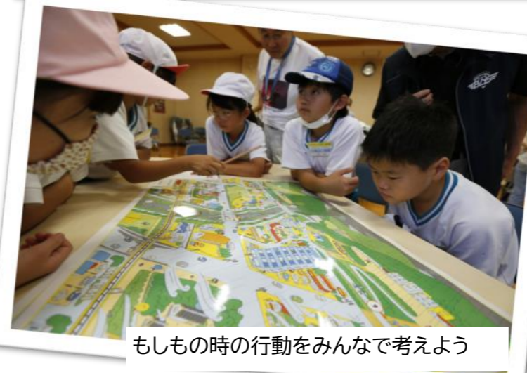
もしもの時の行動をみんなで考えよう

第11回目を迎えた合宿通学は7月14日(金)吉川小学校の4年生60名が参加し、テーマは「防災」で、地震からの火災を想定した避難訓練や水消火器を使った消火訓練、「みんなで考える防災クイズ」等を行い、防災について楽しく学ぶことが出来ました。残念なことに、2日間の開催予定でしたが、1日目の7月13日(木)は、大雨の為、小学校の臨時休校と、公民館が避難所となったため中止となってしまいました。