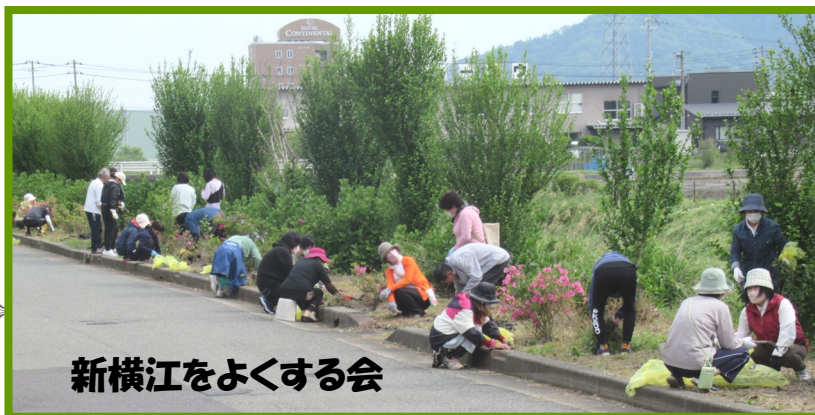
新横江をよくする会