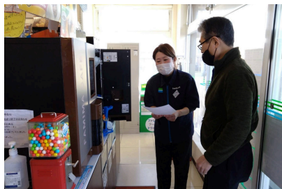
【青少年育成協議会】