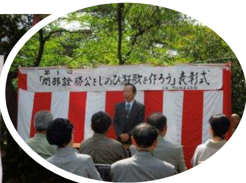
主催：鯖江地区区長会