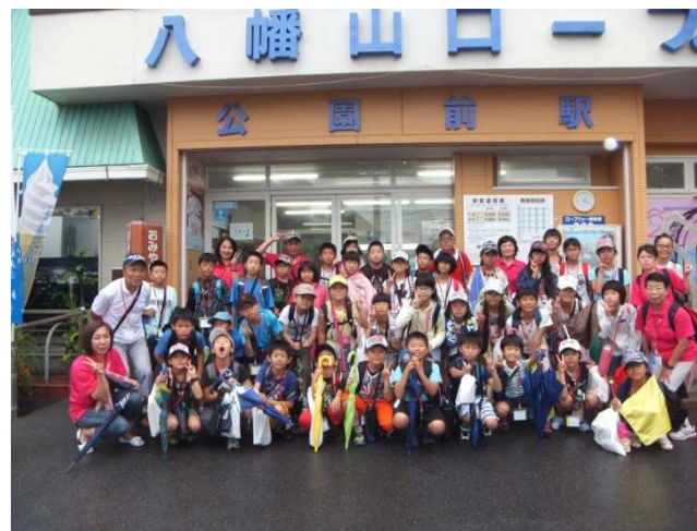
↑みんなで記念撮影ハイポーズ