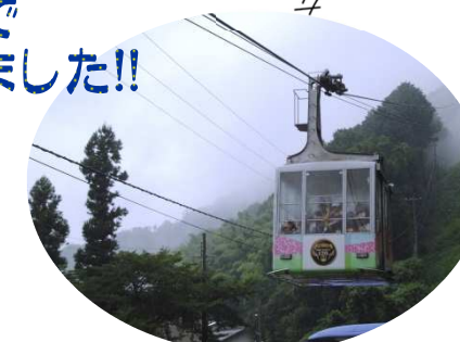
↑ロープウェイに乗りました