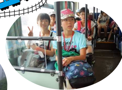
↑バスにも乗りました

7月26日(火)に借陰・進徳小学校3〜6年生39名が滋賀県近江八幡の「八幡山」に行ってきました。あいにくの雨で、予定していた屋形船での「八幡堀めぐり」は、残念ながら出来なくなりました。乗って山頂の展望台まで行きました。展望台からの眺めは、雲に覆われ何も見えませんでした。でも、おいしいお弁当を食べて、元気に選んでいました。帰りは特急しらせに乗り、無事に鯖江に戻って来ました。