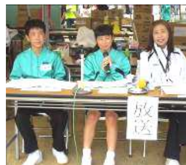
↑ 地元中学生が、実行委員としてお手伝い。アナウンス係!