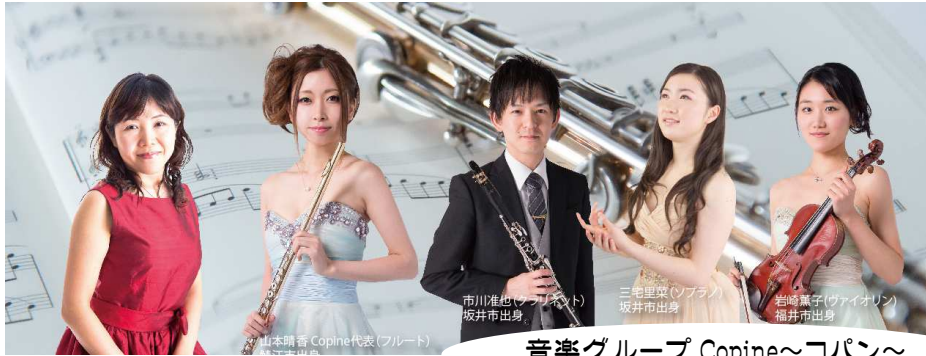
音楽グループ Copine～コパン～

新たな歴史を刻む公民館 鯖江市に縁ある演奏家たちが集い 素晴らしい演奏で幕開け致します。