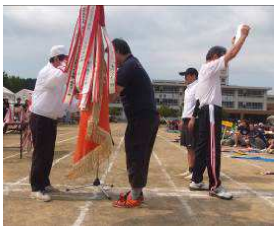
↑ 総合優勝おめでとう。

→ お昼のアトラクションは鯖江市やんしき保存協会による“やんしき踊り”でした。一般の方や子ども達も参加し、みんなで踊る楽しい“やんしき踊り”になりました。