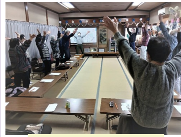
みんなで準備体操!

当日は22名が参加し、参加者が少ないと言われがちな男性も11名と多く、会場は開始前からにぎやかな雰囲気に包まれていました。