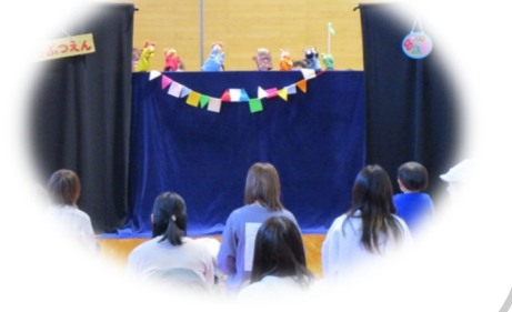
主催:鯖江地区子育て支援ネットワーク委員会