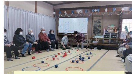
ボールでレクリエーション

笑顔と笑い声があふれ、楽しみながら体を動かす様子が印象的で、4グループに分かれての対抗戦では、ゲームとはいえ皆さん真剣に取り組まれ、会場は熱気に包まれていました。