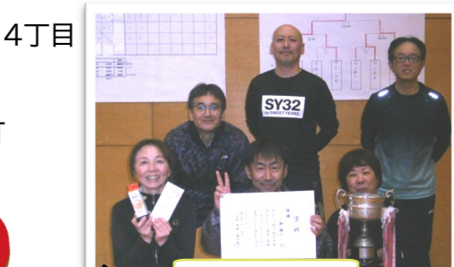
優勝おめでとう ございます!