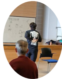
主催:鯖江地区老人クラブ連合会