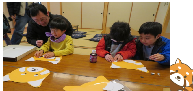
大人気のレッサーパンダのふく笑い!