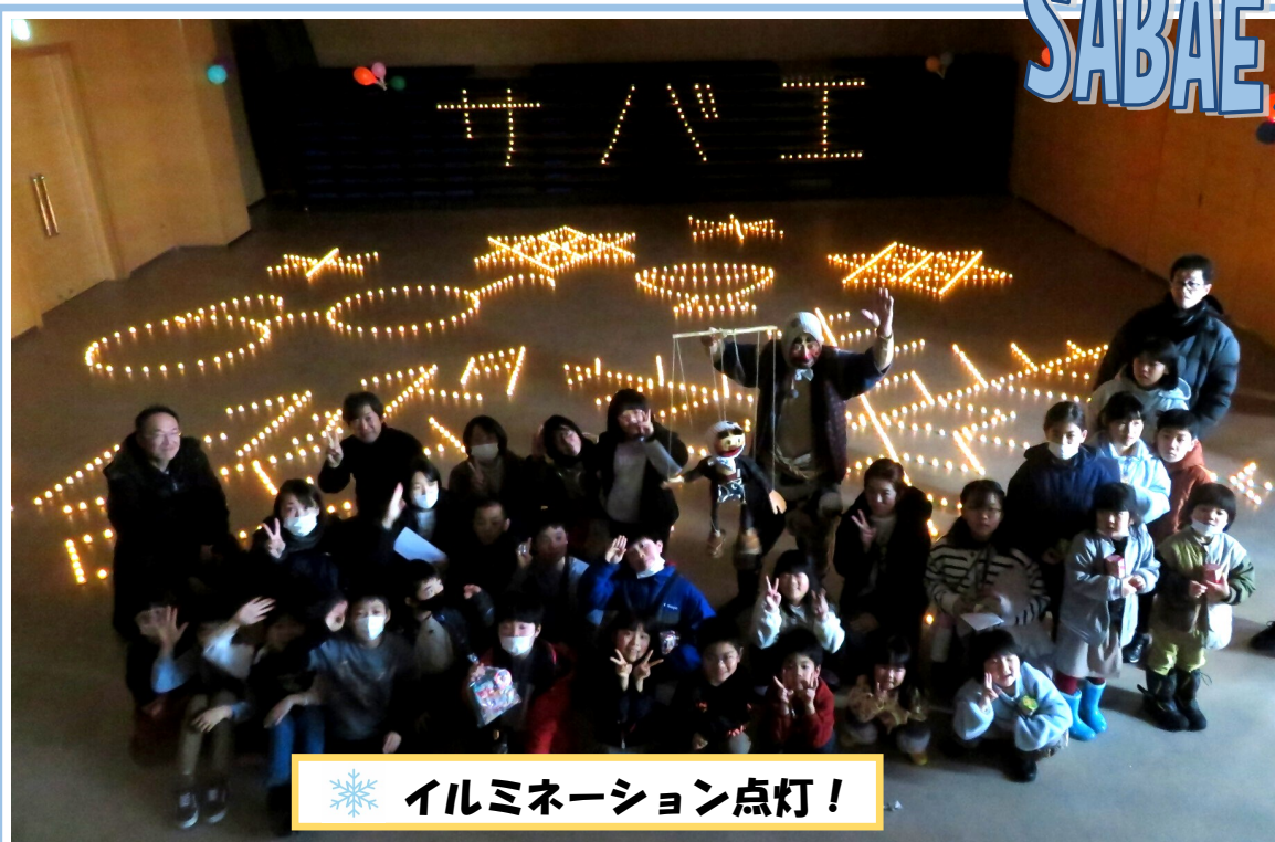
イルミネーション点灯!