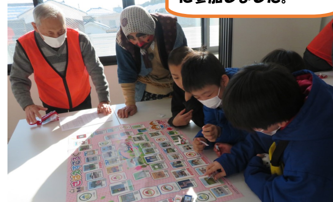
主催:スノーフェスタ実行委員会