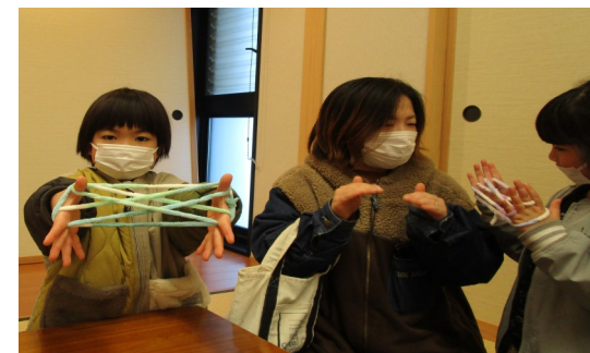
あやとりで“田んぼ”できたよ!