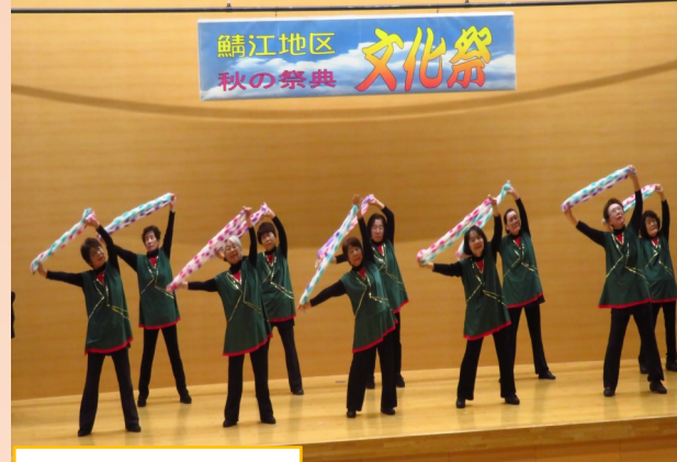
鯖江リズム体操会

10月29日(日)、秋晴れの中、鯖江地区文化祭が盛大に開催されました。1階のロビーでは園芸教室の寄せ植えが出迎え、2階は力作ぞろいの作品など文化講座と各種団体の活動の成果が展示され、3階大ホールでは舞台発表が行われました。舞台発表は鯖江中学校吹奏楽部の演奏で幕が開き、合唱や詩吟、日本舞踊、スッコプ三味線、やんしき踊りなど9つの文化講座の発表が行われ、観客から大きな拍手を浴びていました。また、女性の会のバザーや青少年育成協議会の焼きいもをはじめ、焼き鳥、おろしそばなど食のコーナーも賑わっていました。