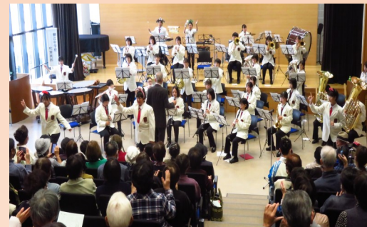
鯖江中学校吹奏楽部