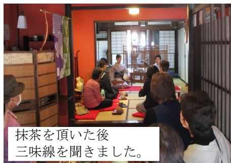
抹茶を頂いた後 三味線を聞きました。