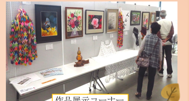
作品展示コーナー