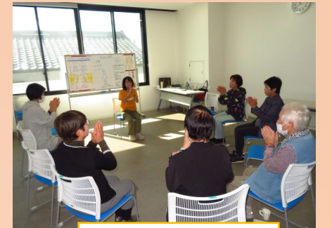
健やか気功クラブ