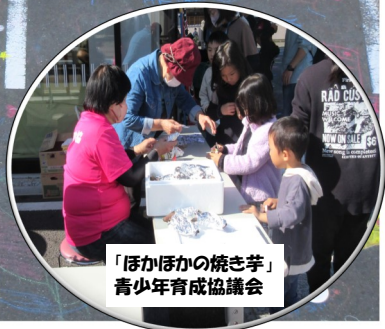
「ほかほかの焼き芋」 青少年育成協議会