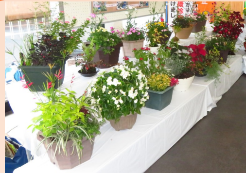
園芸教室 寄せ植え