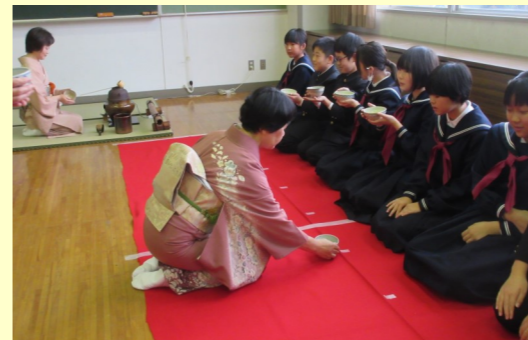
【伝統文化茶道体験（進徳小学校）】