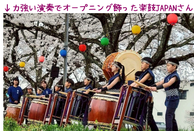
↓力強い演奏でオープニング飾った楽鼓JAPANさん