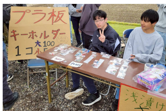
↑↓中学生の模擬店。こしの都ネットワークさんに取材されていました。

←小学6年生(新中1年生)の模擬店。スノードーム作りのワークショップでは、キラキラのラメやキャラクターのフィギュアを入れたオリジナル作品作りを体験できました。