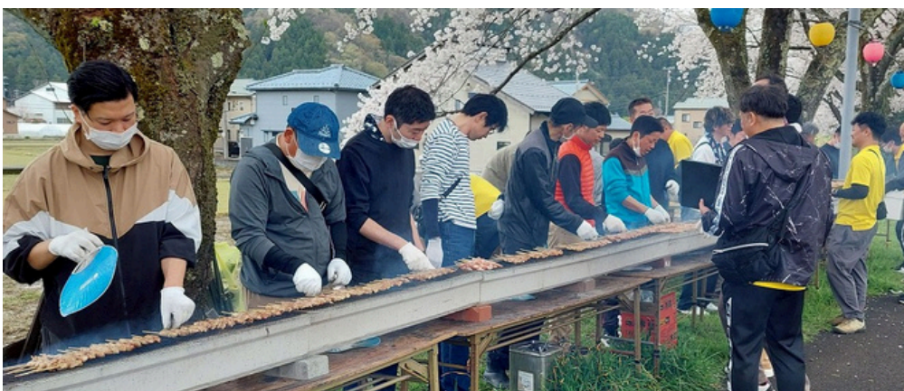
↑模擬店開始30分で2500本の焼き鳥が売り切れたとのこと!

早朝は小雨がぱらつき地面も濡れていましたが、いつの間にか雨も止み、満開の桜並木の下には大勢のお客さまがいっぱい!どの模擬店も長い列ができ、大賑わいでした。