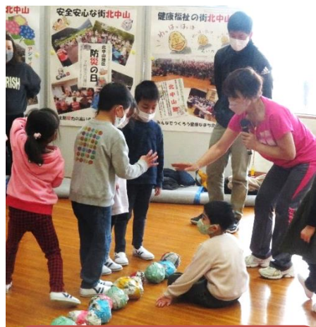
新聞紙で作ったボールでボール投げゲーム

親しみやすい「鯖江弁」の台詞がわかりやすく、会場は大笑い!最後に市役所より、あの手この手で迫る悪徳業者にだまされないよう、対処法をわかりやすく説明していただきました。最近、プリペイドカード詐欺や訪問買取詐欺が多発しているそうです。皆さん、気をつけましょう。