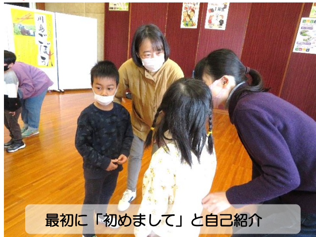
最初に「初めまして」と自己紹介

2月12日(日)、春から新一年生になる親子を迎えて「顔合わせ会」を開催しました。