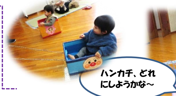
ハンカチ、どれにしようかな～

2月21日(火)、延期となっていた「ぴよぴよ運動会」と「COSAPO人形劇」を開催しました。運動会では、「電車でゴー」や「赤白玉入れ」「ハンカチとりゲーム」など親子で楽しみました。年齢が同じぐらいの子たちが参加頂き、交流の場にもなりました。