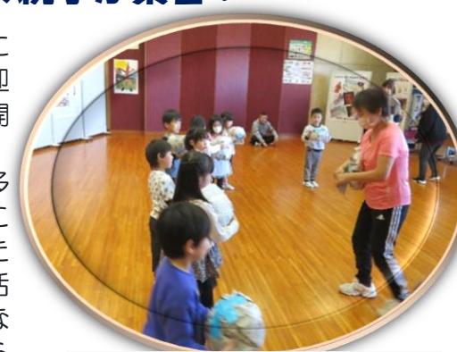
新聞紙で作ったボールで ボール投げゲーム

親も子も、一人でも多くの人と顔をあわせることで、小学校へ入学したときに安心して学校生活が過ごせるきっかけになればという願いが込められています。