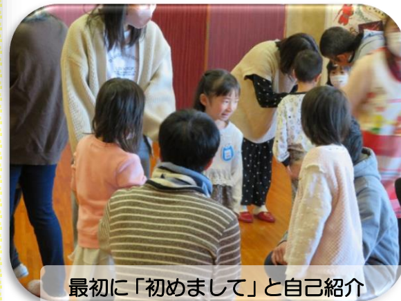
最初に「初めまして」と自己紹介

2月12日(月)、4月に新一年生になる親子を迎えて「顔合わせ会」を開催しました。