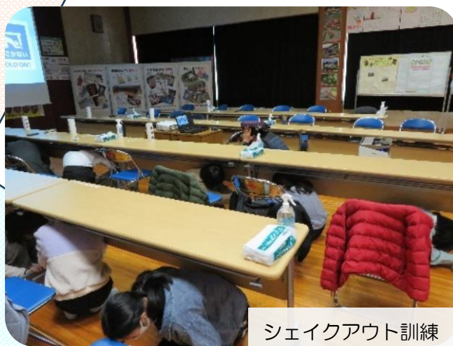
シェイクアウト訓練

1月28日(日)北中山公民館で北中山小学校6年生ふるさと学習会が開催されました。