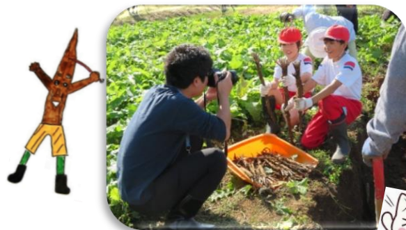
多くの方が取材に来られました