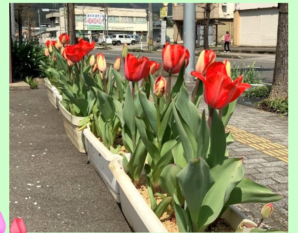
河和田コミセン前道路のチューリップ

今年も、河和田地区のあちらこちらで桜が満開になりました。例年より暖かい日が続き、いつもより早い春の便りになりました。皆さんのお気に入りのスポットはどこですか？