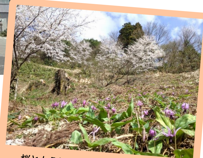
桜とカタクリの共演! 中山公園