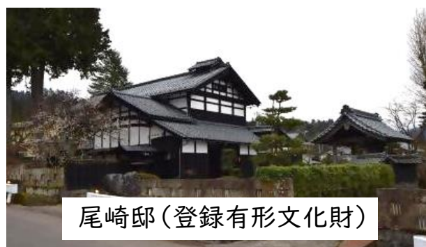
尾崎邸(登録有形文化財)