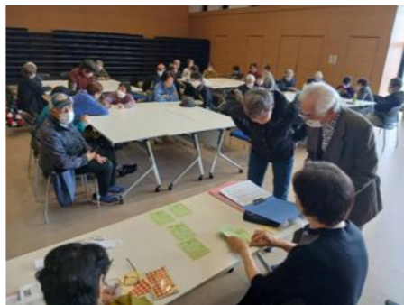
主催:鯖江地区老人クラブ連合会

自己紹介の後、友達の輪を広げることを目的に、LINEの使い方を学びながら参加者同士でグループを作成しました。初めての方も安心して操作を覚えることができ、「これから連絡が取りやすくなる」といった喜びの声も聞かれました。当クラブでは、ウォーキングや輪投げ、健康づくり、小物づくり、バス旅行など、毎月さまざまな活動を行っています。