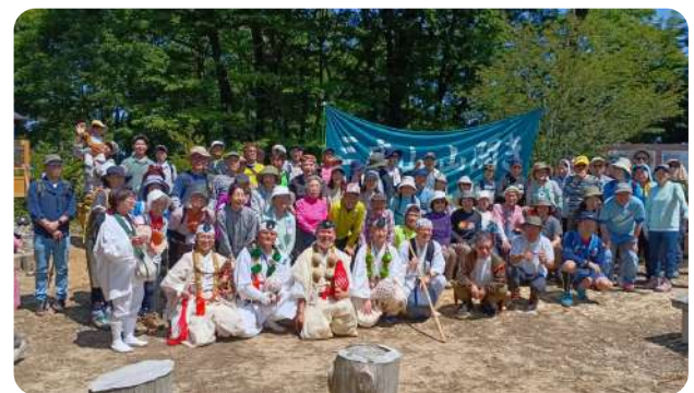
【三床山を愛する会】

山頂では、神事、白山龍鳴会による恒例で人気の法螺貝吹鳴や護摩焚き等もあり、参加者は眼下に広がるパノラマ景色を眺め、感動しながら楽しいひとときを過ごしました。