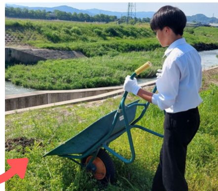
集めた泥を、一輪車で堤防へ運んでもらいました！