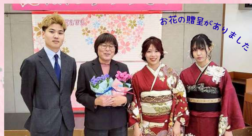
地区からの記念品

恩師からのお祝いの言葉では「80億人を超える人が暮らしている地球で、偶然ひとつのクラスで一緒に学び、成長してきた皆さんは不思議なご縁でつながっている。ふるさとや仲間を大切にこれからも過ごしてほしい。」と、お話されました。