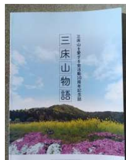
三床山を愛する会

内容はこれまでの活動に加え、三床山に因む歴史的事実や山麓の豊・吉川・佐々生地区に関連した事項も記載され、いわば三床山アラカルの編集構成となっています。写真も多く読みやすく記念誌としてはユニークな小冊子となっています。ぜひ、ご覧一読いただき三床山に関心や親しみを持っていただければ幸いです。