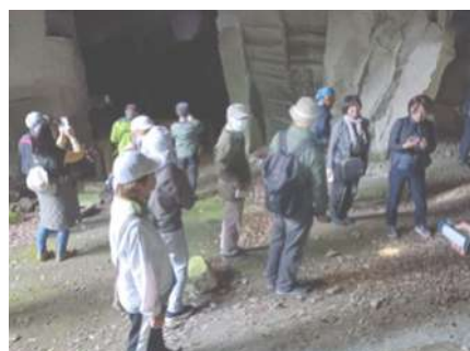
主催：豊の宝を見つけよう応援団