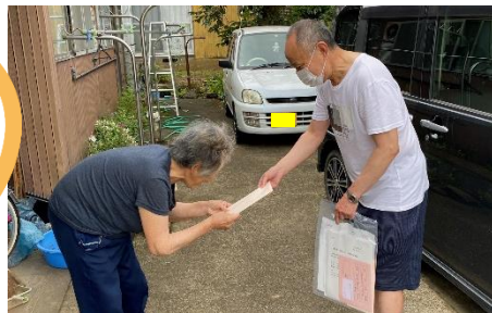
おひとりずつお会いし、記念品を手渡ししました