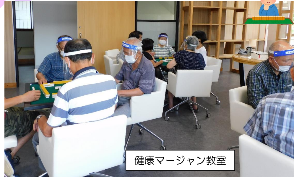
健康マージャン教室