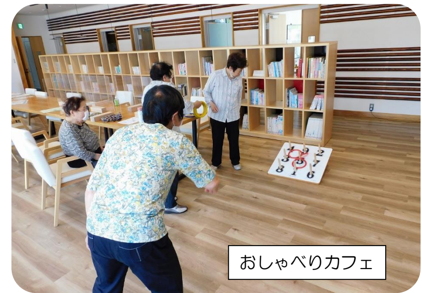
おしゃべりカフェ