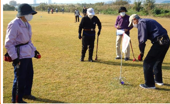
主催：神明地区社会福祉協議会

10月28日(木)秋晴れの中、日野川河川敷公園緑地で、神明地区社会福祉協議会グラウンドゴルフ大会を開催しました。皆さん元気にプレーを楽しんでいました。