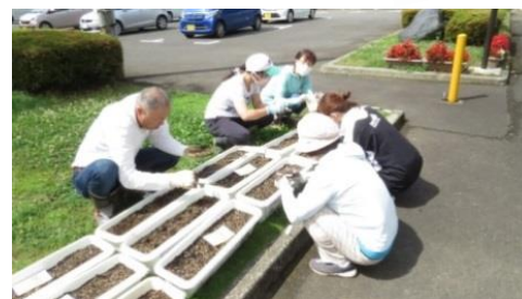
プランターにミニひまわりの種まきもしました