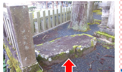
黒石の石橋(越前のそで橋)

文化財として「日吉神社の神像郡10軀」が収められている。特に 笏谷石製のサル像 は、鯖江市では例を見ない遺品であり、また、神社入口に置かれている「黒石の石橋(越前のそで橋)」は、昔、朝倉義景より、原村にいた八田嘉左衛門氏がもらったと言われている。