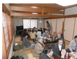
仲間との楽しいおしゃべり