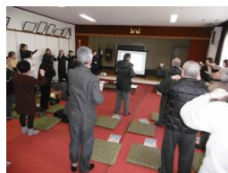
市の詐欺被害防止の話