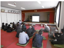
薬剤師さんの薬の話