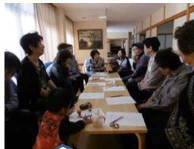
楽しくおしゃべりタイム