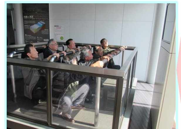
実際に起きた地震を体験しました