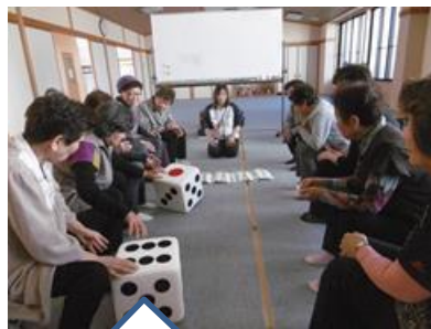
ふたりで11の目よ! サイコロをふって!

11月2日(金) 10:00 ~ 12:00 石田下町公民館 11名(お世話役含む) 参加しました 感想: 市の社協の定期巡回です。大きなサイコロでゲーム。 楽しく、大賑わいでした。その後は会話ありの楽しいひと時でした。