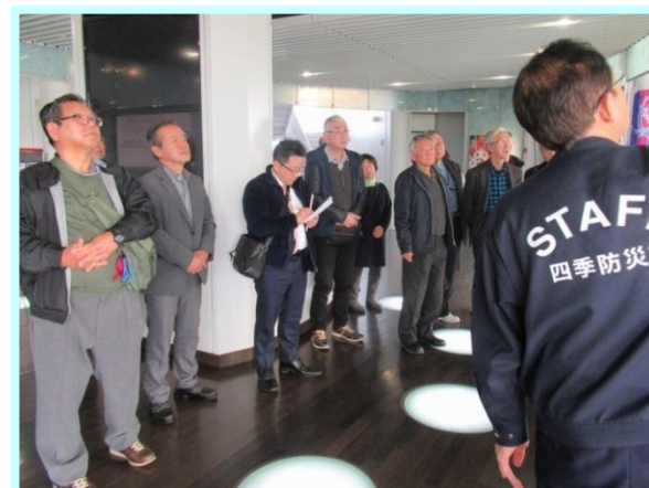
職員さんから地震のメカニズムについて説明を受けました