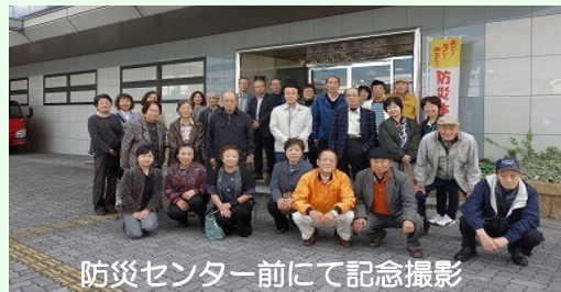
防災センター前にて記念撮影

10月30日(火) 奈良市防災センターに行ってきました。館内では、地震の揺れを振動装置でリアルに体験できる「地震体験」、煙の中を避難する「煙避難体験」、火災映像に向かって消火器訓練ができる「消火体験」、室内で強い風を体験できる「台風体験」などがあり、災害時の対応について指導や説明をしていただきました。その後、薬師寺、平城宮跡を見学し、奈良の歴史や文化に触れました。爽やかな秋空の下、皆さん交流を深め充実した一日を過ごしました。