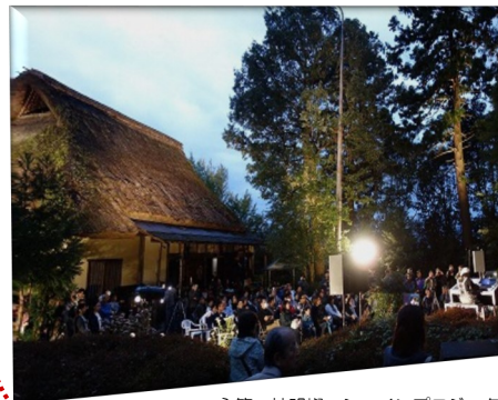
主管 神明燦・シャインプロジェクト

10月27日(土)、旧瓜生家住宅、神明社を中心に「まちかど歴史浪漫コンサート 星降る夜の音楽会」が開催されました。旧瓜生家住宅で、電子オルガン奏者「826aska」「陽影月」が出演され多彩な音色が夜空に響き渡りました。また「神明ミステリーウォーク」も同時に開催され、神明地区の歴史を探して約30名の参加者は、街並みを歩きました。