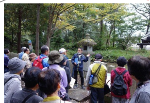
まなへの館の深川学芸員さんによる説明

10月27日(土)、旧瓜生家住宅、神明社を中心に「まちかど歴史浪漫コンサート 星降る夜の音楽会」が開催されました。旧瓜生家住宅で、電子オルガン奏者「826aska」「陽影月」が出演され多彩な音色が夜空に響き渡りました。また「神明ミステリーウォーク」も同時に開催され、神明地区の歴史を探して約30名の参加者は、街並みを歩きました。