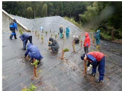
↑雨の中作業を行う委員さん↓

9月29日(土)今年も「あじさいのまち北中山」を目指してアジサイの植栽を行いました。戸トンネル法面と福井今立線の県道、川島町の鞍谷川堤防、そして北中山児童センター跡地の4か所に植えました。また、各町内にも植栽し、今年もあわせて800本のアジサイを植えます。整然と植栽されているアジサイ苗がとても綺麗で、見ていると気持ちがいいです。