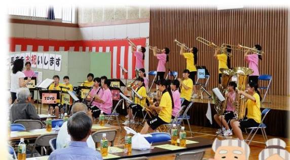
東陽中ブラスバンド部