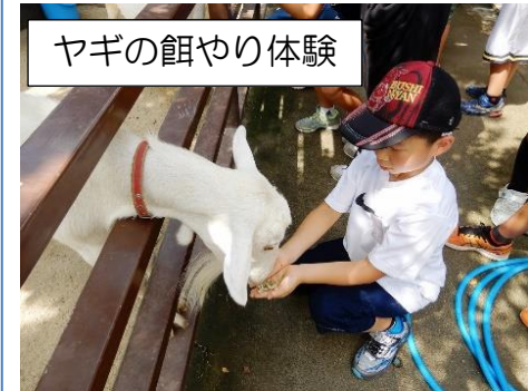
ヤギの餌やり体験