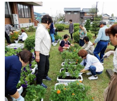
プランターの花刈込