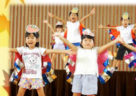
可愛い北中山幼稚園の皆さん