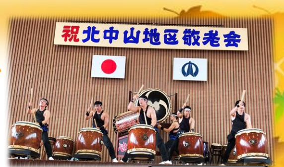
ハツ杉権現太鼓の皆さんによる太鼓演奏

9月16日(日)雨予報で天気が心配されましたが、当日は雨風なく無事に開催することができました。式典の最後には参加された皆さんで、北中山名物「笑いの三笑」を行い、これからのますますの健康をお祈りしました。