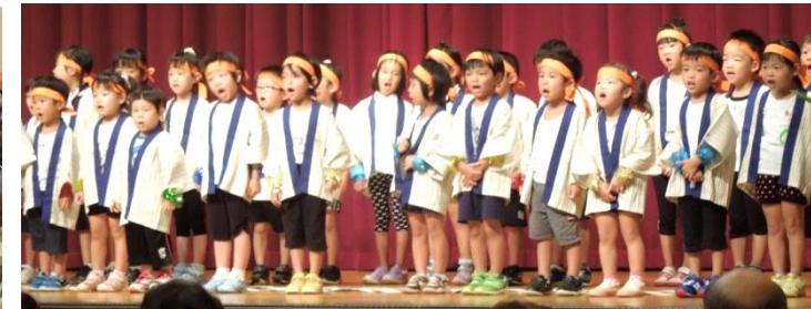
アトラクションを楽しむ来場者の皆さん(左)と、早稲田保育所(右上)、やなぎ保育園(右下)の皆さん