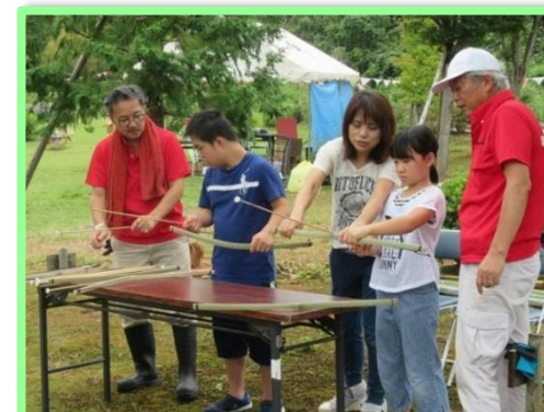
竹の弓矢の射的コーナーもありました