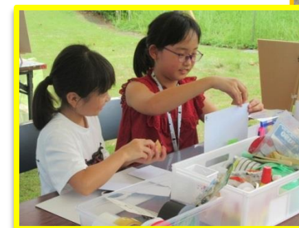
ワークショップコーナーで作品作り