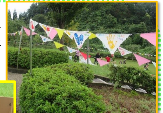
会場を彩る手形フラッグ