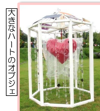
大きなハートのオブジェ