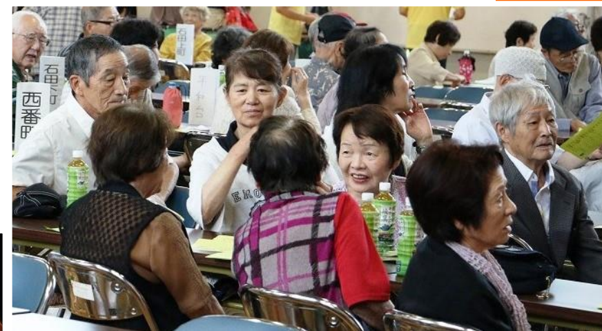
アトラクションを楽しむ参加者の皆さん