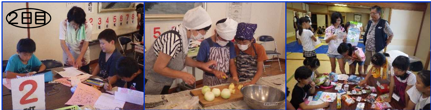
☆家族への手紙書き☆