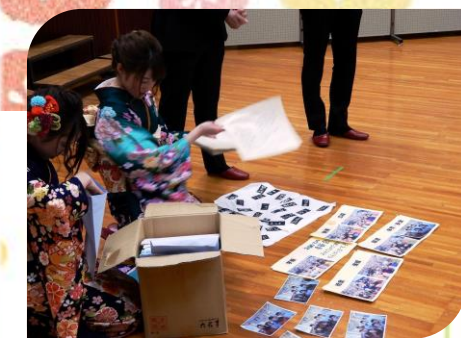
1/2成人式の時に作ったタイムカプセルの開封をしました。懐かしいものがたくさん!

隣の会場では新成人の保護者の皆さんによる懇親会が行われ、艶やかな着物姿やスーツ姿の成人の皆さんと一緒に写真を撮る光景も見られました。