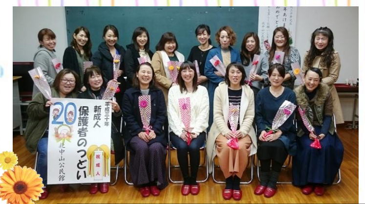
新成人からガーベラの花を買った保護者達。立派になったねと涙ぐむお母さんもいました。