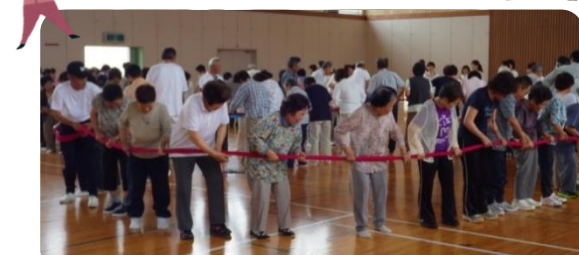
北中山地区老人クラブ連合会・婦人会