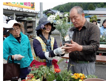
講師から、花の特徴を教えてもらいながら作業していきます。

5月14日(月)花のまち倶楽部を開催しました。この季節にあう、かわいらしい寄せ植えが出来上がりました。花の高さや色など、バランスを考えて寄せ植えするのは難しいようですが、講師の指導により、素敵な寄せ植えに仕上がりました。