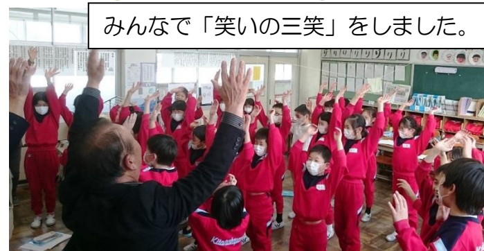
みんなで「笑いの三笑」をしました。

北中山地区は弥生時代や南北朝時代等からの古い言い伝えが沢山残っている地区です。語り部の会はそれらの歴史や伝承を5年前から毎月学習しています。そして今回は3年生を対象にいくつかのお話をしました。子どもたちは語り部から聞いた話を手作りのカルタに描いて友人に伝えるとのことでした。子供たちの生き生きとした眼差しで取り組んでいる姿は地区の宝です。