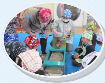
きな粉づくりの様子