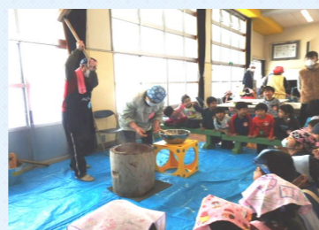
おもちつきの様子