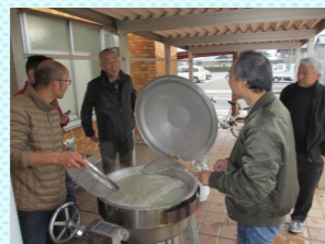
大きな釜で蕎麦を茹でます