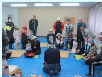
そば打ちの指導中!

出来上がったそばは、大きな釜で茹でてもらい、おろしそばにしてみんなで頂きました。やはり打ち立てのそばは、香りもよく歯ごたえがあり皆さん何杯もおかわりしていました。