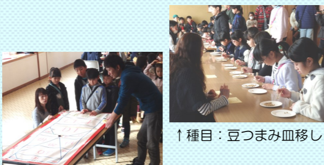
↑種目: 豆つまみ皿移し