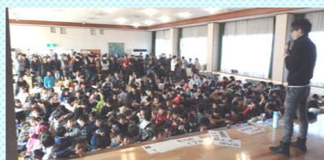
閉会式の様子 いよいよ 入賞者発表!