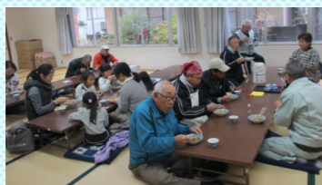
みんなでごやかに試食会♪