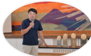
あわら市の灯源郷の方に ご指導頂きました