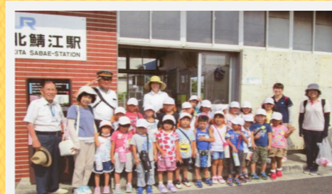
門田名誉駅長さんと一緒にパチリ!

7月31日(月)北鯖江駅から大土呂駅まで電車に乗り、神明幼稚園の5歳児がブルーベリー摘みに行きました。