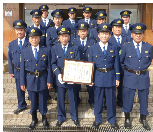
鯖江市防犯隊豊支隊の皆さん