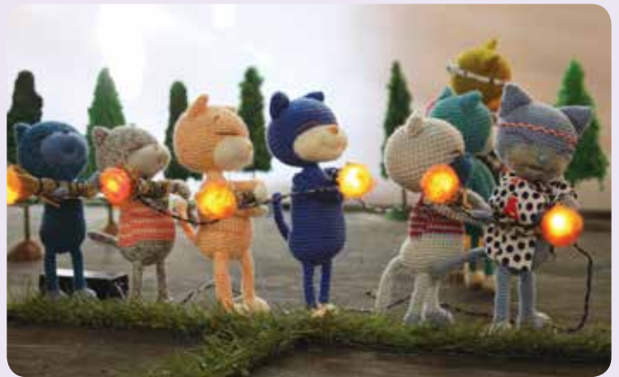
虫送りの子どもたち