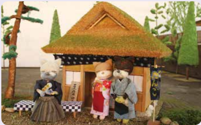
坂本龍にゃとお茶屋