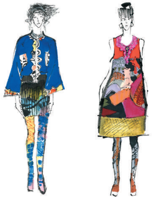
《スタイル画 2015SS 時の彷徨》墨、カラーペン / 紙