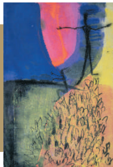
《WORK #1227》アクリル絵具、木炭、パステルマーカー、紙 / 木製パネルに布