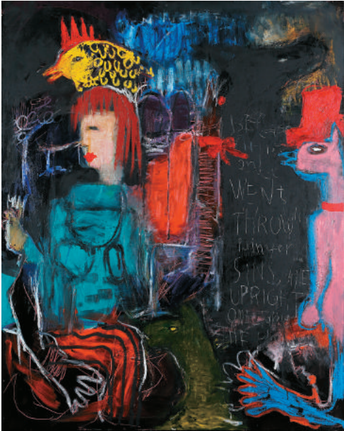
《WORK #1646》油彩 / キャンバス