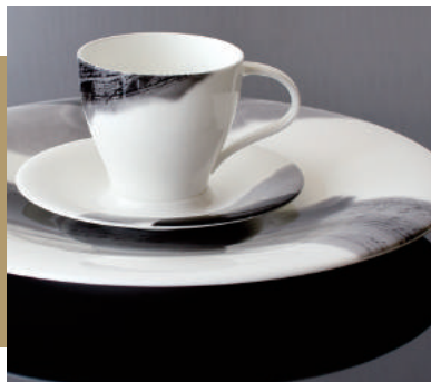
《墨の瞬シリーズ》 ファイバーグラスチャイナ / ニッコー株式会社