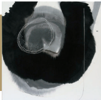
《WORK #1035》墨、銀箔 / 木製パネルに和紙

公式ウェブサイト：ヒロココシノ http://www.hirokokoshino.com KHギャラリー http://www.kh-gallery.com