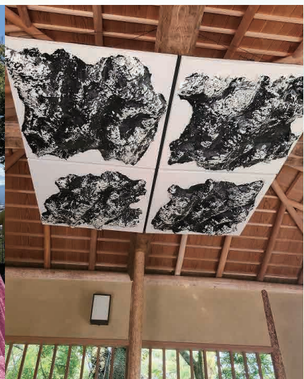
2025 招聘アーティスト作品 『Red or White』2010 藤江 竜太郎