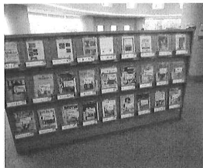
雑誌スポンサー提供雑誌を集めた棚

提供雑誌の増加により雑誌コーナーは充実し、多くの利用者が訪れる、ホットなスポットになっています。